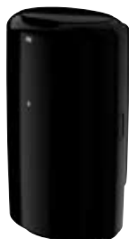
Hulladékgyűjtő tetővel (B1)