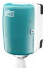
Belsőmag adagolású rendszer (M2)