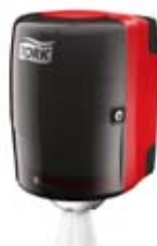
Belsőmag adagolású rendszer (M2)