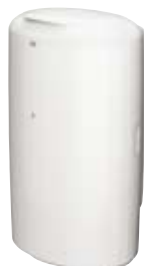
Hulladékgyűjtő tetővel (B1)